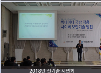
2018년 신기술 시연회